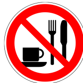
Essen und Trinken verboten