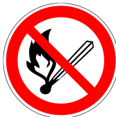
Feuer, offenes Licht u. Rauchen verboten